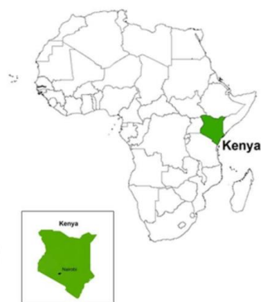
図 1：アフリカ・ケニア地図

国際連合は 2030 年を達成期限とした持続可能でより良い世界を目指す「持続可能な開発目標（以下 SDGs）」を 2015 年に掲げた。この SDGs では地球上の「誰一人残さない」ことを誓い、17 の目標に取り組んでいる。保健分野においては、目標 3「すべての人に健康と福祉を」に加え、他分野にわたる縦断的な目標が掲げられている。分野ごとのターゲットは事細かに記載されているが、全体を見る時に、全ての人々が幸せに生きることができると言っても過言ではない。東アフリカに位置するケニア共和国（図 1）においては、小児死亡率などがここ数十年で低下して健康状態が改善している一方で（図 2）、障がい児（者）は SDGs の「誰一人取り残さない」の「誰一人」からは程遠い現状がある。