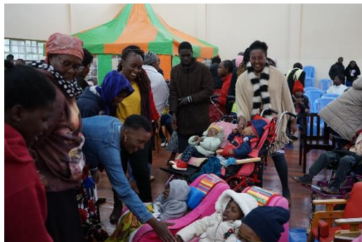
写真5：地域との合同礼拝で子どもたちと交流する地域住民

日には家族そろって教会に行くことが多くの地域で慣習となっているが、シロアムの園の通園児は約8割が教会に行くことができていない。理由は地域内での差別や偏見の目や、子どもたちの移動手段がないなど様々であるが、これらの子どもたちがご家族や地域の人たちと共に礼拝を守る機会の提供は子どもたちの社会参加のひとつであり、また地域の人たちが子どもたちと交流する場としても重要である(写真5)。更に、国会議員や地方行政官が直接子どもたちやご家族と対話する機会を設けたり、他のパートナーとの協働を心がけることも行っている。