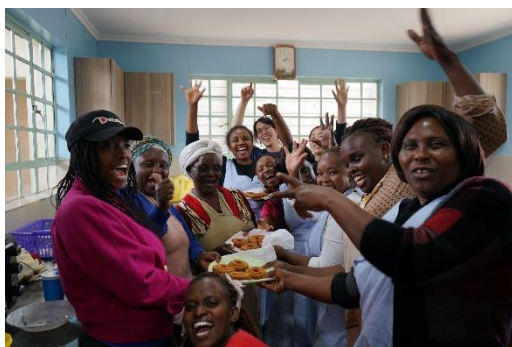
写真4：障がい児の保護者たちの行う ドーナツ作り・販売事業

る。障がい児の家族であるがゆえに孤独であったり、経済的な問題を抱えていたりする家族に対して、シロアムの園では収入向上を目指す活動を実施しているが、その活動を通して収入向上のみならず、家族同士が励まし合い、支え合う関係を築くことができている（写真4）。