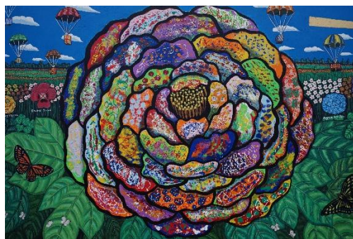
写真6：シロアムの園の障がい児と家族、アーティストによって描かれた壁

会がどのように子どもたちを大切に、障がいのある子どもたちの存在を喜び、障がいのある子どもたちがどのように社会に貢献していくことができるかを考えつつ、共生社会を目指していくべきと考える。写真6の壁画の牡丹の花は、シロアムの園の子どもたちがそれぞれご家族と一緒に、一枚一枚の花弁をそれぞれの思いで作成した。その個性的な一枚一枚の花びらがひとつの花をつくる時に、同じ色の花びらの牡丹よりも更に美しいものをつくることができ、個々の強みが活かされた。そのような社会を創っていきたい。