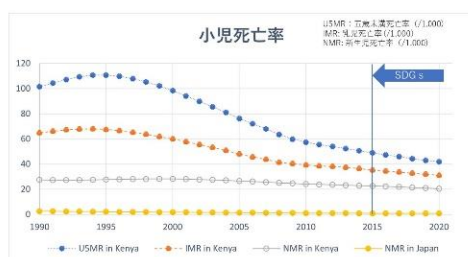
図 2：小児死亡率推移 (the United Nation Inter-agency Group for child mortality estimation)