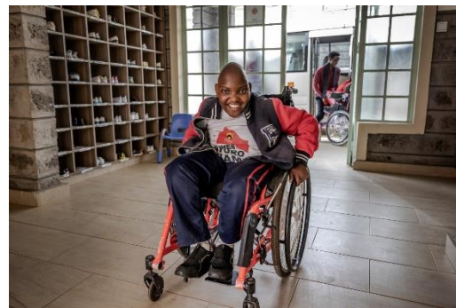
写真3：広くバリアフリーの施設内を自由に車いすで動き回るJ

このような事実を通して、インフラ改善やユニバーサルデザインが子どもたちの自立や意思決定につながることを示すことができる。また、ケニアのリハビリや特別支援教育は、ニーズに対するアプローチではなく、症状を改善するアプローチが中心であり、またそのアプローチもエビデンスに基づくものでないことが殆どである。このため、生活や個々のニーズや困りごとを子どもたちやご家族と共に考え、身の回りにあるものを活用した療育、エビデンスに基づき、子どもたちが楽しみながら自発的に行うことができる活動を目指しているシロアムの園の活動は、療育や支援のモデルとして発信することができる。